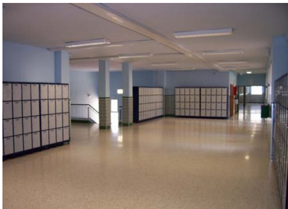
Módulos de taquillas de la 1ª planta