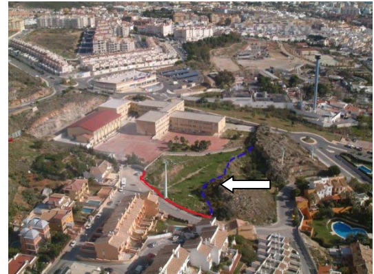
Zona cedida por el Ayuntamiento

- Desde 2009 contamos con teléfono móvil y también tenemos un correo electrónico: ampacerrodelviento@yahoo.com