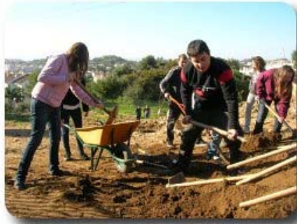
Alumnos en el huerto

lima, limonero, mandarino, manzano, melocotonero, membrillo, morera, naranjo, níspero normal y de invierno, olivos en distintas variedades, peral, pomelo. Se siembran dos de cada clase para que haya una buena polinización.